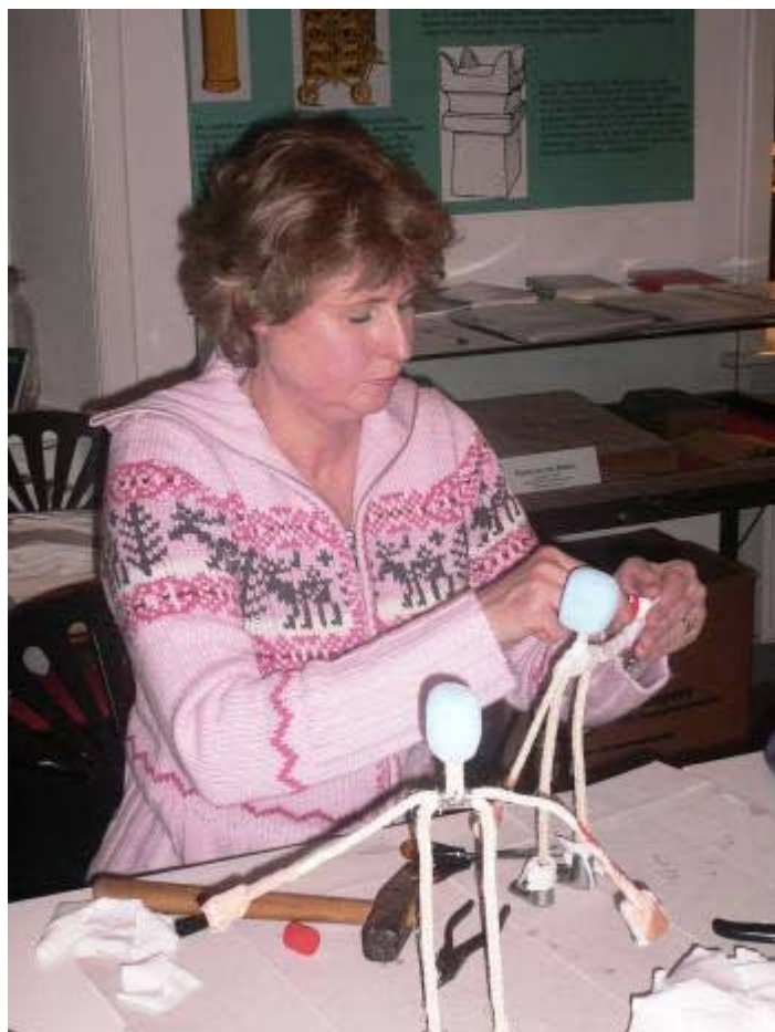
Werkkurs 11. - 12.11.05 Bibelzentrum, Schleswig