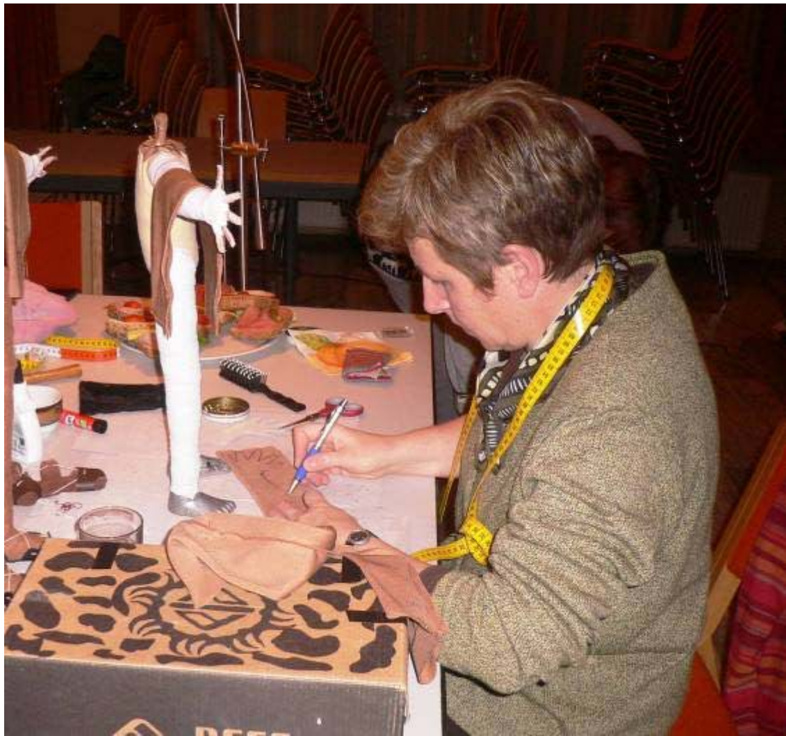
Arme und Beine aufzeichnen