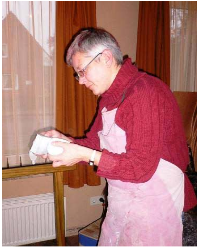
Samstagsmorgen: Gesichter schleifen