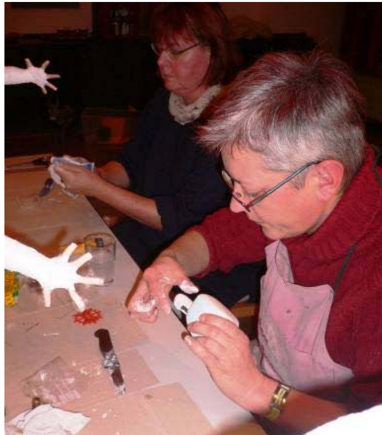
Gesicht und Hals modellieren